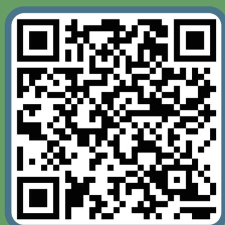
Kalkulator sewa jangka kedua

Aturan sewa yang diperbarui Penyewa dapat menegosiasikan sewa baru dengan pemilik properti