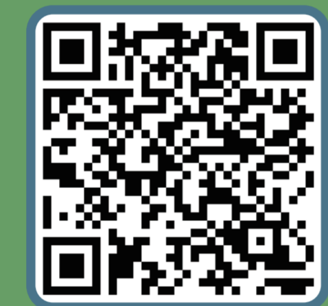
Công cụ tính giá thuê Hợp đồng thuê nhà kỳ thứ hai

Giá thuê gia hạn được quy định Người thuê có thể thương lượng giá thuê gia hạn với chủ nhà