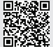
Keluhan Masalah Penyewaan

Jika Pemilik diduga melakukan pelanggaran berdasarkan Undang-undang, silakan laporkan ke Departemen ini sesegera mungkin. Untuk detail, silakan kunjungi: