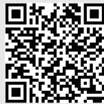
Formulir Penyampaian Elektronik